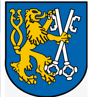
Dom zu Liegnitz